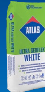
ULTRA GEOFLEX WHITE